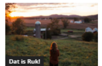
Dat is Ruk!

Wie wil emanciperen, moet orgasme-gel smeren